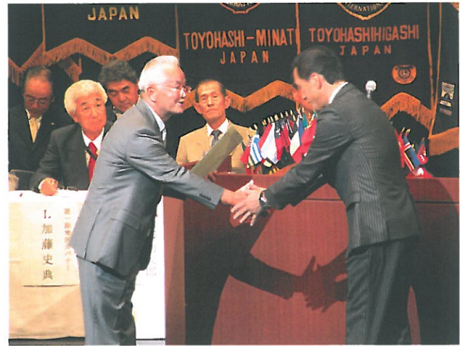
梅岡会長よりガバナーへ回答書の提出