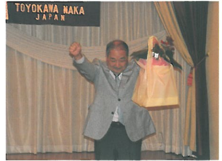
LL お誕生日プレゼント