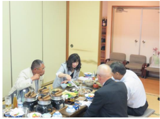
楽しい昼食の様子