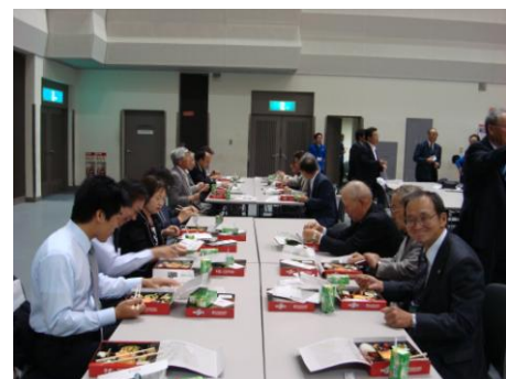
昼食会場での様子