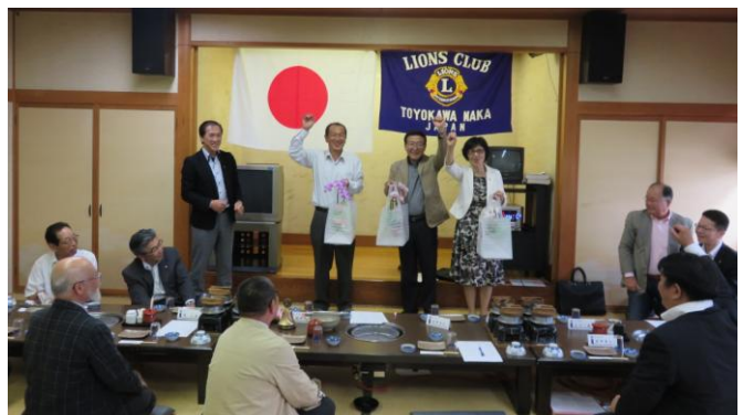
LLお誕生日花プレゼント