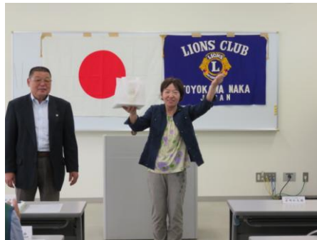
お誕生日プレゼント