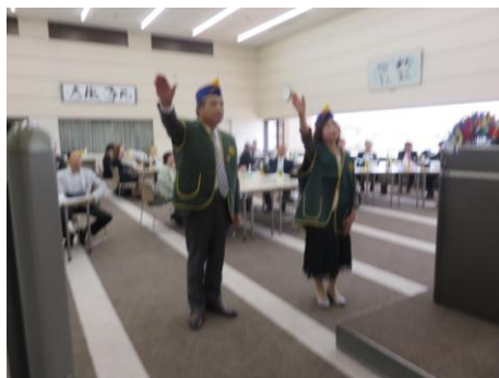
池田第一副会長とライオンズの誓い