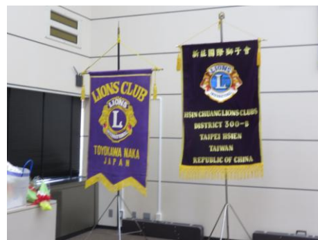
クラブ旗 ポールの長さが整いました