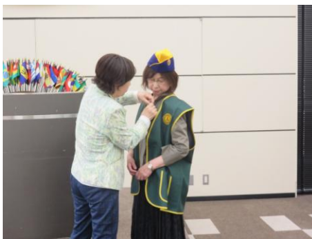
スポンサーよりバッチの贈呈