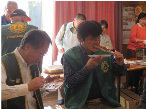
2台の焼き台で、200本の五平餅を焼きました。調理員さんがポテト、大学芋を差し入れして下さり 焼きあがった五平餅とともに、子ども達とクラブ会員はおしゃべりをしながら食べました。