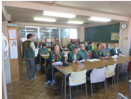
池田会長 挨拶 例会の様子