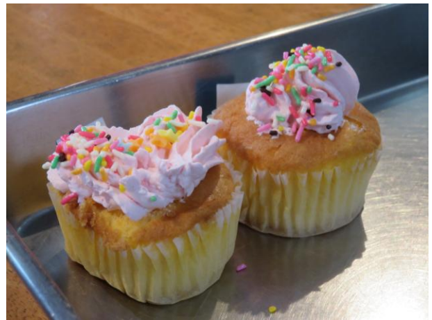
子ども達がデコレーションをしてくれたカップケーキ。美味しそうです。