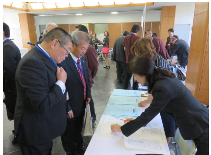
年次大会 受付の様子