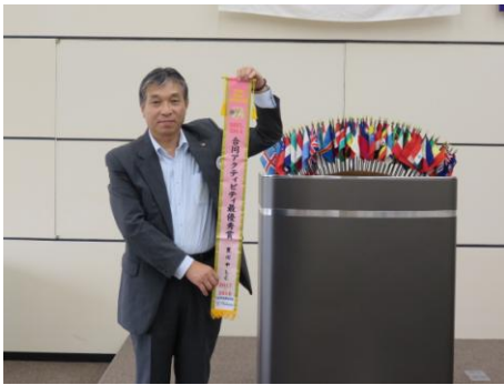
アワード披露 合同アクティビティ最優秀賞