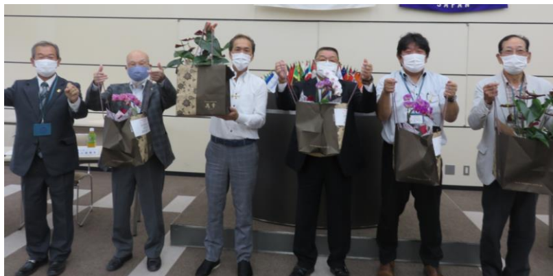
7月 ライオン・ライオンレディ お誕生日花プレゼント