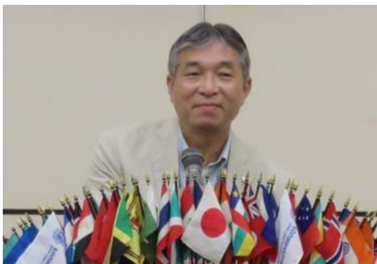
2R 2ZZC L 池田 力