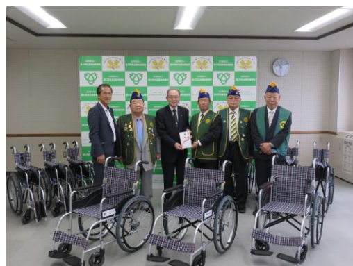
豊川市社会福祉協議会 12台寄贈