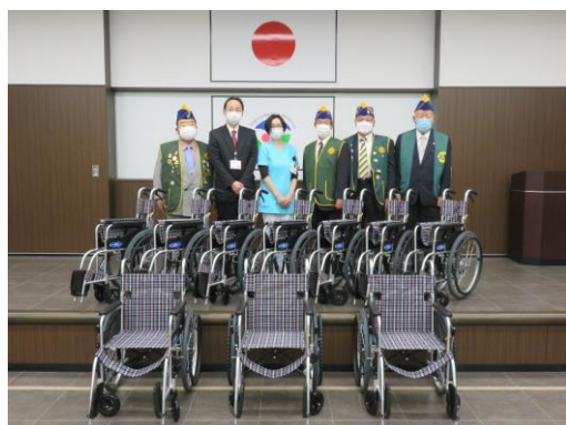
豊川市民病院 10台寄贈