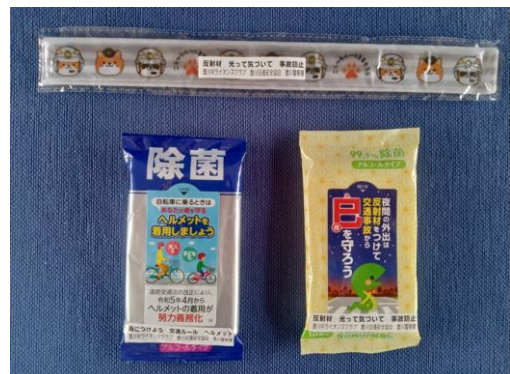
反射材、除菌シート（2種）