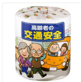
トイレットペーパー