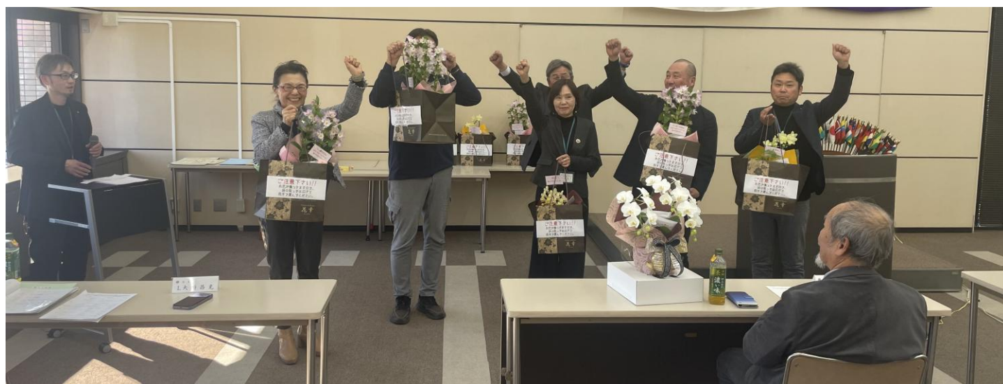
ライオン・LL・ライオンパートナーお誕生日プレゼント