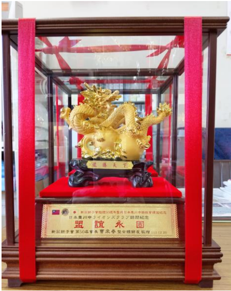
台湾新莊獅子会からの贈り物